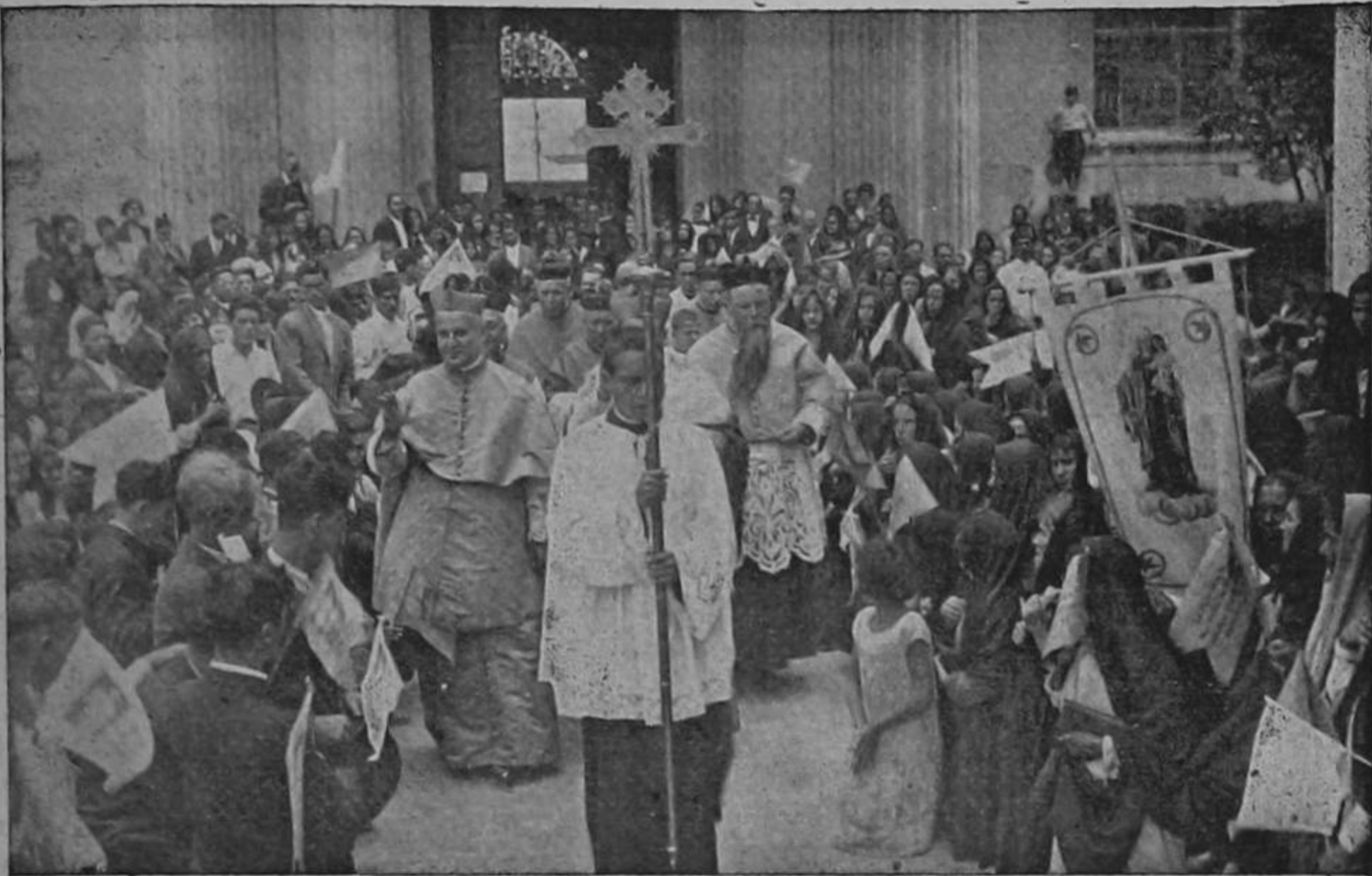
Los Prelados, después de la Misa Pontifical, dirigiéndose al Palacio del Excmo. Sr. Arzobispo

La Fiesta del Papa celebrada en la Catedral Metropolitana el jueves 15 de agosto próximopasado